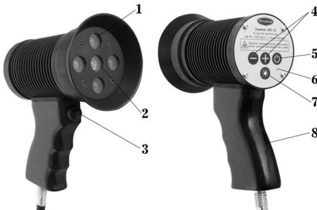
Рисунок 1 – Общий вид светодиодного ультрафиолетового светильника Элитест УФС-12 Black Light